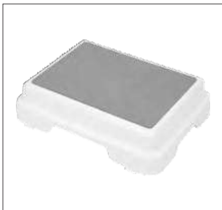
ESCALÓN PARA BAÑO