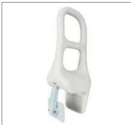
BARRANDILLA PARA BAÑERA