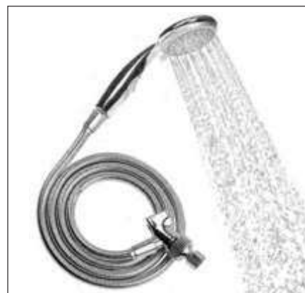
DUCHA DE MANO