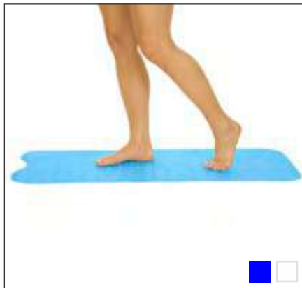
ALFOMBRA DE BAÑO DE 38" x 15"