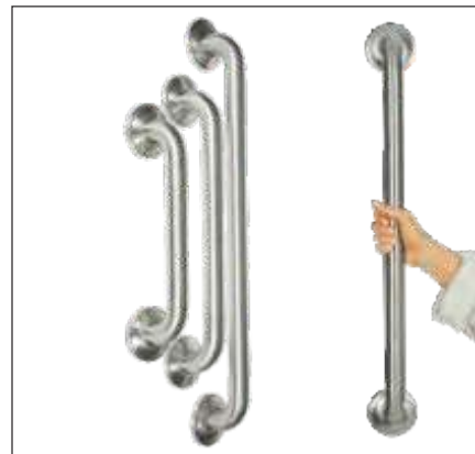
BARRA DE SEGURIDAD METÁLICA