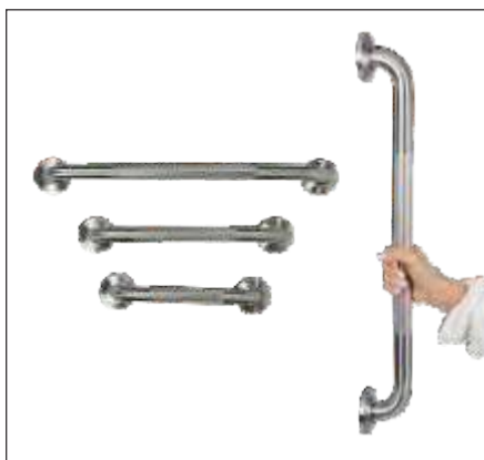
BARRA DE SEGURIDAD DE METAL TEXTURIZADO

Tamaños: 12", 16" y 24" Acabado: níquel cepillado, bronce y blanco.