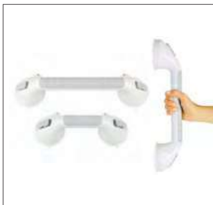
BARRA DE SEGURIDAD CON SUCCIÓN