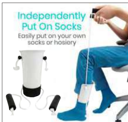
DISPOSITIVO PARA PONER MEDIAS