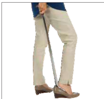
CALZADOR DE METAL DE 31,5"