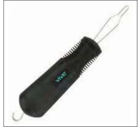
GANCHO PARA BOTONES