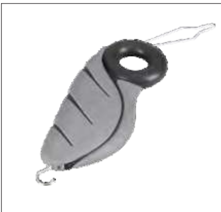
GANCHO PARA BOTONES (CON ORIFICIO PARA EL DEDO)