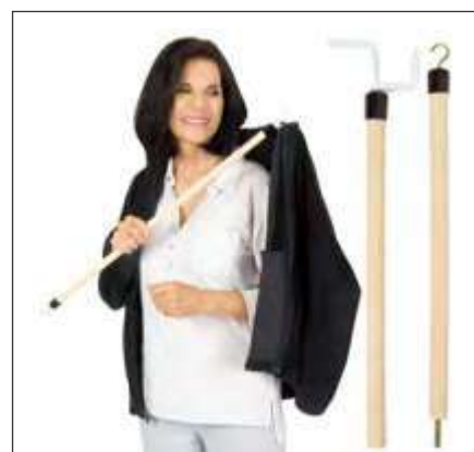
BASTÓN DE VIAJE PARA VESTIRSE