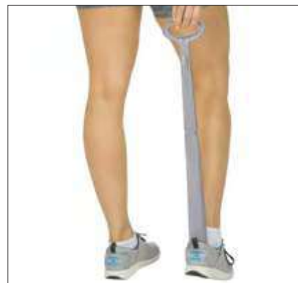
CALZADOR DE 23" CON QUITACALCETINES