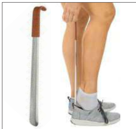
CALZADOR DE METAL DE 16,5"