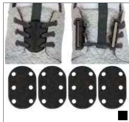
CIERRES DE CALZADO MAGNÉTICOS