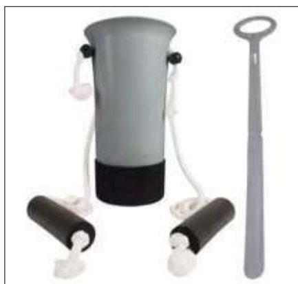
KIT DE ASISTENCIA PARA MEDIAS Y CALZADO