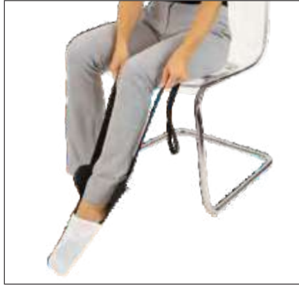
DISPOSITIVO FLEXIBLE PARA PONER MEDIAS