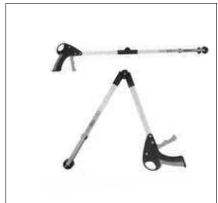
ALCANZADOR PLEGABLE CON VENTOSA