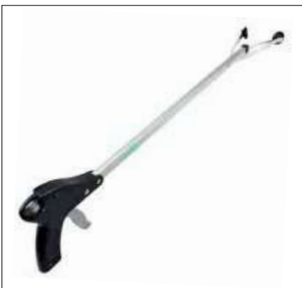
ALCANZADOR DE OBJETOS CON VENTOSA