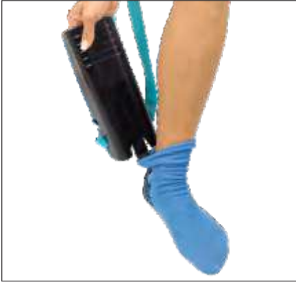
APARATO PARA PONER Y QUITAR MEDIAS