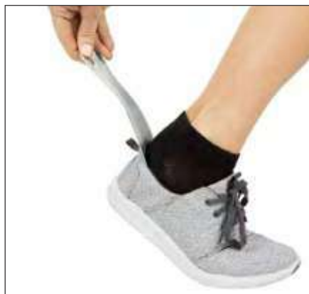
CALZADOR DE METAL DE 7,5"