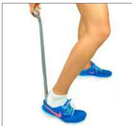
CALZADOR DE 24"