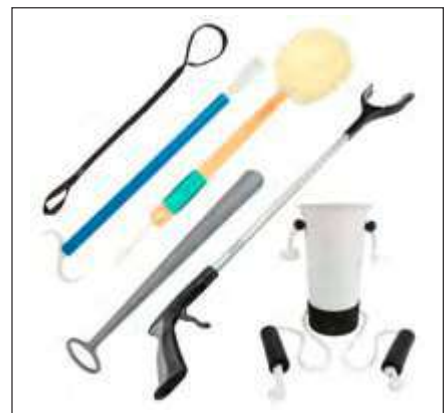
KIT DE RECUPERACIÓN DE CÁDERA Y RODILLA